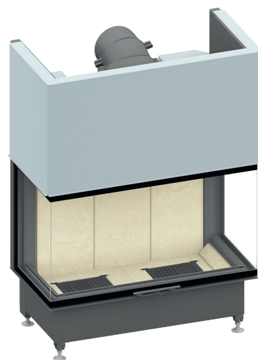
Ekko U 100(45)57 mit hochschiebbarer Front